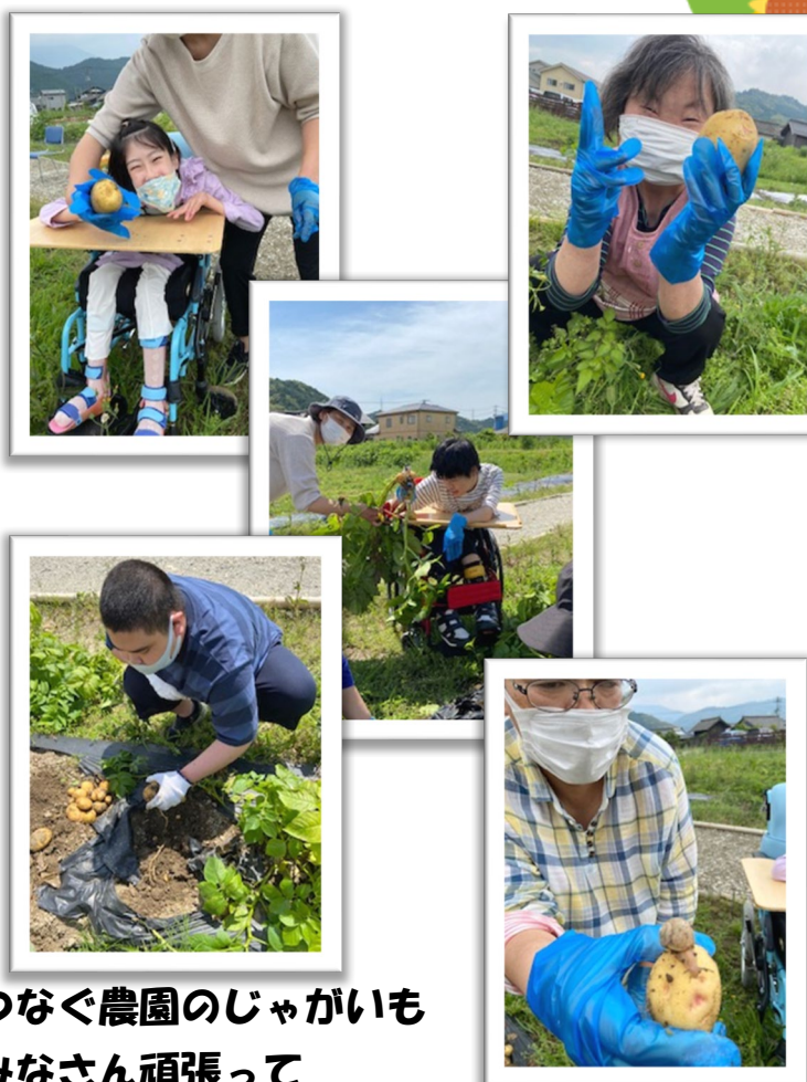
つなぐ農園のじゃがいも みなさん頑張って たくさん収穫できました。