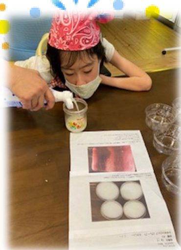
7月 かき氷のシロップを使って ひんやりゼリーを作りました。