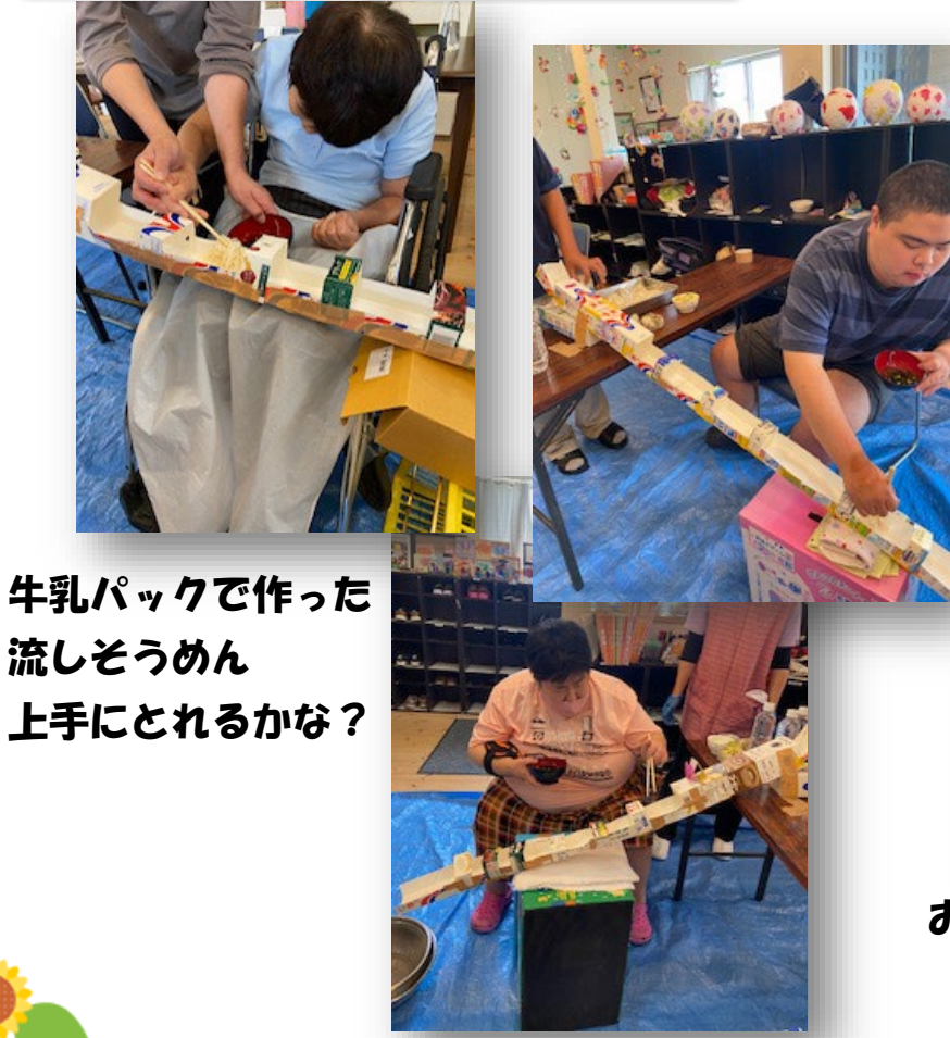
牛乳パックで作った 流しそうめん 上手にとれるかな?