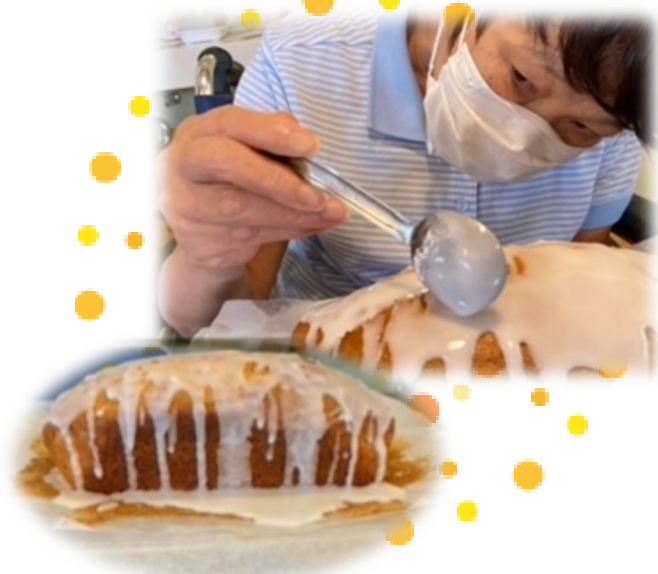
8月 しモンを使って パウンドケーキを作りました。