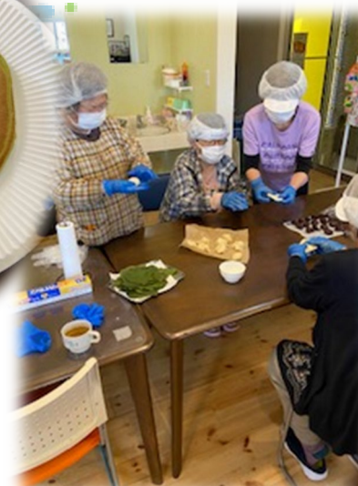
5月 柏餅を作りました。