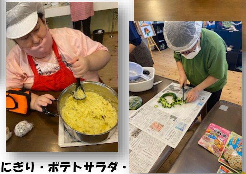
おにぎり・ポテトサラダ・ 流しそうめん